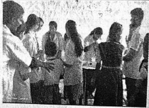
रक्तगट तपासणी शिबीरातील एक क्षण